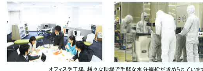
オフィスや工場、様々な現場で手軽な水分補給が求められています。

高温多湿の職場で作業するスタッフの熱中症対策はもちろん、乾燥する冬場の体調管理にも水分補給大切といわれています。職場で手軽な水分補給の手段として喜ばれています。