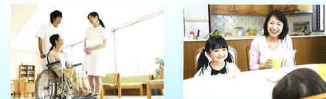
ご家庭や医療施設など様々なシーンで活躍しています

古くなった配管(通常寿命40年)や、給水器を使用していると、定期メンテナンス費等の増加や、水の衛生面、安全面の不安が懸念される他、水の味にも影響します。