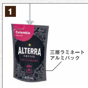
三層ラミネート アルミパック

全ての抽出作業がドリンクパック内で行われ、ブルーワーカー機の中は水しか通らないため、マシンのメンテナンス清掃にかかる時間は、ほんのわずか！